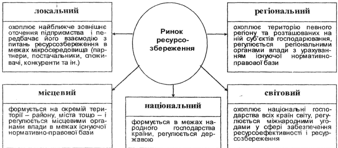
Рис. 2. Рівні ринку ресурсозбереження

На наш погляд, за масштабами ринок ресурсозбереження (ресурсозберігаючої продукції) доцільно поділити на такі рівні (рис. 2).